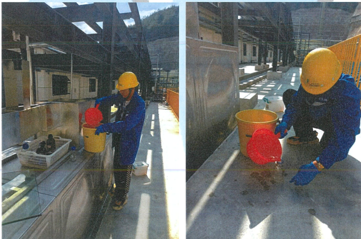
7-2 部分现场采样照片