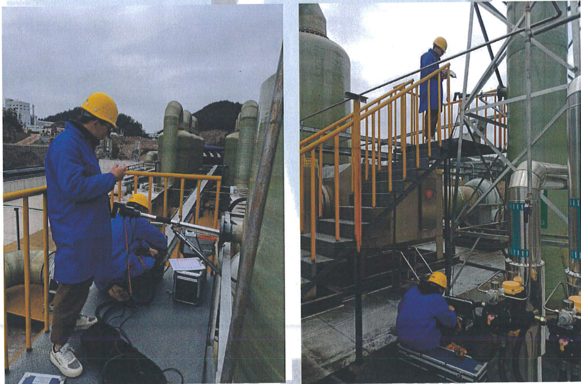
图7-2 部分现场采样图片